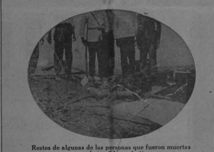
Restos de algunas de las personas que fueron muertas por la terrible explosión

al Papa suplicamos recomendar las acciones relativas á las asociaciones religiosas. Califica la acción como una mala. Tetán.—El célebre francés gestiona con los moros notables para que protesten por la construcción de los caminos de Cuba. Madrid, 28.—La asamblea de San Francisco envió un telegrama á Mery del Val, de satisfacción al Pontífice con motivo de la solemnidad apertura. El Pontífice anhela porque esa asamblea sea en beneficio de la Iglesia y que el ciclo prosiga á la católica España. Hubo discursos, incluso uno de Pidal en que habló de la sinceridad de la vida y el cristianismo. El teatro estaba lleno y adornadísimo. En el certamen eucarístico pronunció discursos Barrero, Agüero y demás preladados. Alicante, 28.—En Sax los pedricos arrastran con las cosechas. Las pérdidas se calculan en un millón de pesetas. Coruña, 28.—El capitán del Gemma ha protestado contra la legal detención. Lo que traía declarado era maquinaria de guerra. Bruselas, 28.—Los aviadores Wymans y Vidiart llegaron hoy de Utrech. El premio ofrecido en Utrech y Bruselas lo ganó Wymans, quien llegó aquí después ayer. Wymans hizo el viaje en 22 horas 45 minutos 22 segundos. Vidiart en 60-52-52, incluyendo el tiempo de las paradas necesarias. El record se toma desde el momento de partida. Barra bajó cerca de la torre japonesa sin golpearse. Lascarrat cayó cerca de Breda según tanto golpeado no se peigué. Mañana reanudarán viaje con destino á Nambrás.