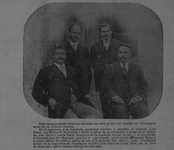
Blen comprenderán nuestros lectores que este grupo fué tomado en Nicaragua antes de los últimos sucesos.